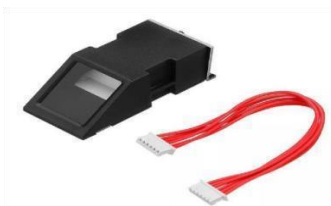
Gambar 2.1 fingerprint sensor

Proses identifikasi seseorang dengan menggunakan sidik jari dinilai sangat akurat, karena pada dasarnya setiap manusia memiliki pola sidik jari yang berbeda – beda dan pola tersebut permanen atau tidak dapat berubah – ubah.