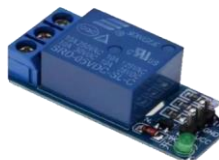
Gambar 2.4 modul relay

Modul relay dapat bekerja dengan mengandalkan arus listrik yang mengalir pada coil didalamnya. Ketika arus listrik mengalir pada coil, maka akan tercipta medan magnet yang menarik tuas pada relay tersebut. Sehingga kondisi pada modul akan berubah yang pada awalnya tertutup ( Normally Closed ), menjadi terbuka ( normally Open ) dan begitu pula sebaliknya