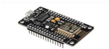
Gambar 2.2 NodeMcu ESP8266

firmware yang, yang menggunakan bahasa pemrograman Scripting lua. Istilah NodeMcu secara default sebenarnya mengarah pada firmware yang digunakan dari perangkat keras development kit NodeMcu bisa dianalogikan sebagai board Arduino-nya ESP8266 .