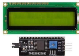
Gambar 2.3 LCD 16x2 & 12C